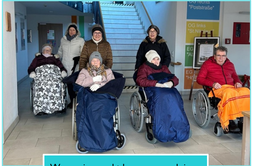
Warm eingepackt kann man auch im Winter die Sonne genießen!

„Man könnte meinen ich hätte etwas angestellt, so wie ich grad schau! Ich genieße aber nur die warme Hüttenwand!“