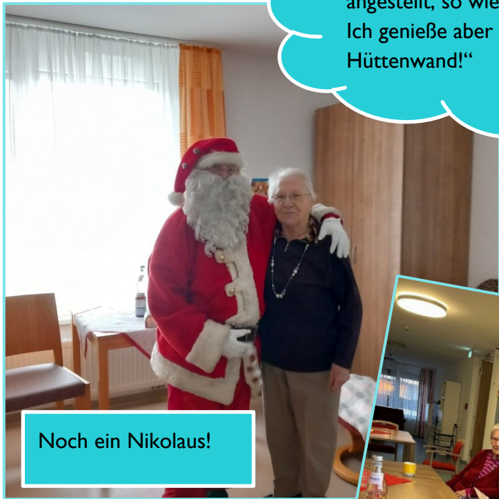
Noch ein Nikolaus!

„Man könnte meinen ich hätte etwas angestellt, so wie ich grad schau! Ich genieße aber nur die warme Hüttenwand!“